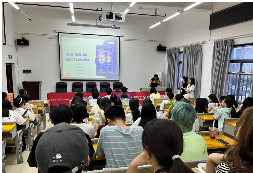
第九届“东方财富杯”全国大学生金融挑战赛我校获奖名单（国赛）

第九届东方财富杯全国大学生金融挑战赛历时 4 个月，经过校赛、省赛、国赛三个阶段，于近日圆满落幕。我校学子荣获国赛一等奖 2 项、三等奖 3 项，省赛一等奖 5 项、二等奖 11 项、三等奖 16 项，创我校参赛以来最好成绩。